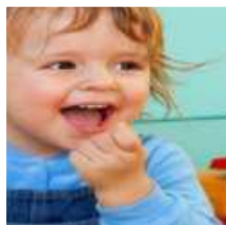
Речевые упражнения и движения (звучащие жесты)