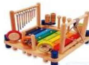
Игра на детских музыкальных инструментах